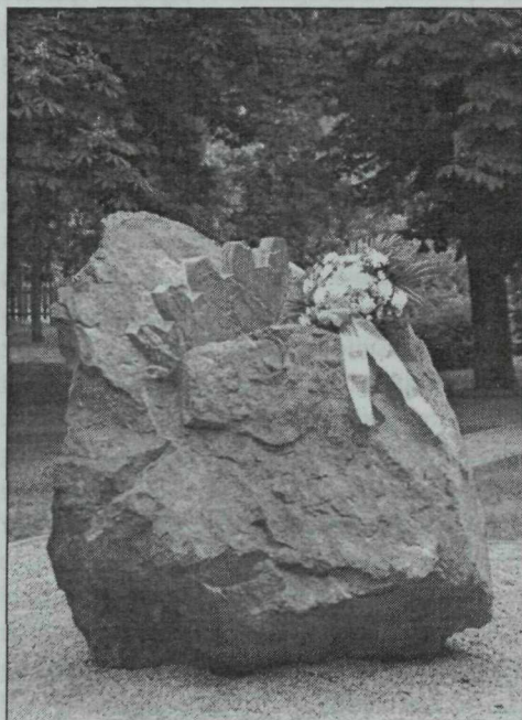
1. kép. Borbás Márton: Rotary-emlékkő