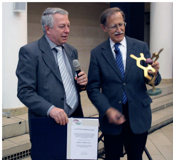
A BioTrans 2017 díjainak nyertesei Vízi Béla-szobrot kaptak

A korábban főleg fejlett nyugat- és dél-európai országokban megrendezett BioTrans konferenciák sikere megerősítette a biokatalízis és a biotranszformáció növekvő jelentőségét és a fokozódó tudományos figyelmet e területek iránt. Ezt az érdeklődést jól jellemzi az is, hogy a megelőző két BioTrans konferencia mindegyikén több mint ötszáz fő aktív résztvevőt regisztráltak. A BioTrans 2017 Budapesten ezen rangos szakmai találkozósorozat tizenharmadik állomása volt, amelyet a BioTrans Conferences Steering Committee magyar képviselője, a Magyar Tudományos Bizottság és a Magyar Kémikusok Egyesületének szakmai segítségével, az Eötvös Loránd Tudományegyetem látgymányosi kampuszán rendezett meg.