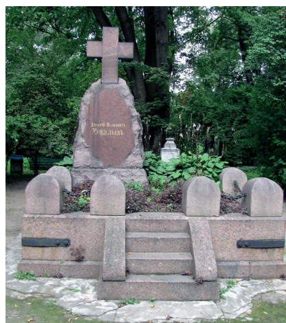
Mengyelejev szentpétervári sírja

Klason különvéleménye miatt a kémiai Nobel-díj-bizottság nem tudott egyhangúlag támogatott javaslatot előterjeszteni Mengyelejev díjazására. Ezzel szemben Klason folytatta erőteljes agitációját Moissan kitüntetésével. Klason ravasz politikusként lépett fel. Egy pillanatig sem tagadta Mengyelejev felfedezésének jelentőségét, ellenkezőleg, mindig kiemelte érdemeit, csak arra vonatkozólag érvelt, hogy nem felelne meg a díjazás feltételeinek. Voltak mások is, akik Mengyelejev munkásságát nem találták elég kézzelfoghatónak, míg Moissan kemencéjét alkalmasnak ta-