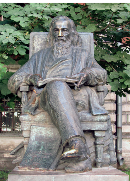
Mengyelejev szobra a szentpétervári Mérésügyi Hivatal előtt

felfedezése és egy olyan kemence kifejlesztése volt, amelyben magas hőmérsékleten lehetett kémiai kísérleteket végezni. Moissan már korábban is kapott jelöléseket és ebben az évben is jóval többen jelölték, mint Mengyelejevet.