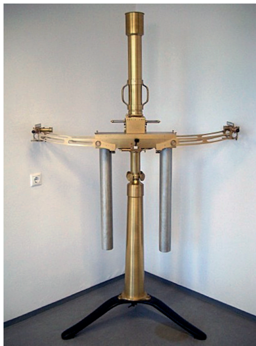
4. ábra. Az Eötvös-féle torziós inga egyik változata, az ún. kettős inga (amelynek két függőleges karja van)

Eötvös felületi feszültséggel kapcsolatos eredményei nagyon jelentősek voltak a maga korában, és amint fentebb írtuk, a kétdimenziós folyadék-állapotegyenletet is róla nevezték el. A tudományos közösség azonban főleg gravitációval kapcsolatos eredményei alapján tartja őt számon. Az eredmények részletezése nélkül említjük itt azt az elméleti és gyakorlati szempontból egyaránt fontos felfedezését, hogy az ún. torziós inga (más néven torziós mérleg) általa jelentősen továbbfejlesztett változatával ( 4. ábra ) sikerült a tömegvonzás törvényében szereplő állandót 9 tizedesjegyre meghatározni. Ez akkora érzékenységnek felel meg, amely a torziós inga közelében elhelyezkedő tömeg néhány kilogrammos megváltozását képes pontosan érzékelni. Eötvös méréseinek pontosságát csak 1963-ban sikerült kb. 50-szeresével (plusz két tizedesjeggyel) növelni. [15] Amikor a Göttingeni Királyi Tudományos Társaság 1906-ban meghirdette a Benecke Alapítvány pályázati kiírását a gravitációs mérések pontosságának növelésére, azt az Eötvös és munkatársai által végzett mérések leírását tartalmazó pályamunka nyerte el, a 3400 márka pályadíjjal együtt. Az elvégzett munka során olyan pontossággal igazolták a súlyos (tömegvonzásból adódó) és tehetetlen (adott erő hatására történő gyorsulásból adódó) tömeg azonosságát, ami meggyezett az akkor elérhető legnagyobb tömegmérési pontosság-