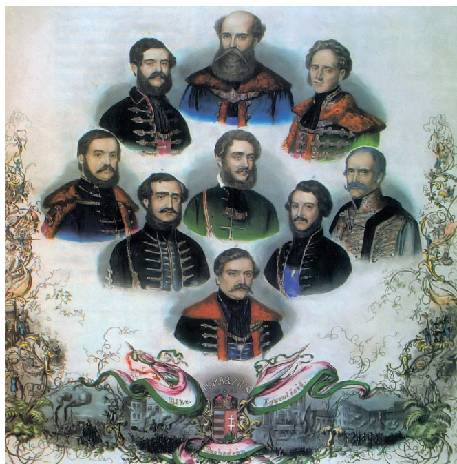
1. ábra. Tyroler József színezett metszete az 1848. március 23-án megalakult Batthyány-kormányról. Eötvös József az alul lévő Deák Ferenc fölötti sorban a jobb oldalon látható

A kormány szeptember 23-i lemondása után Eötvös József ki-