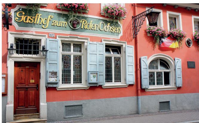
2. ábra. A heidelbergi német tudományosság egyik „központja”: a Vörös Ökörhöz címzett kocsmá (németül: Kneipe). Az 1703-ban épült vendéglátóhely 1839 óta folyamatosan a Spengel család tulajdonában van

„Már többször mondtam és teljesen meg vagyok győződve arról, hogy a német tudományosság a német „Kneipe” (2. ábra) nélkül nem létezhetnék. Bizonyára nem egy nagy eszme sőr mellett született meg, és alkotójától eleinte jó élcnek vagy tréfának volt szána. Ezért ajánlom, hogy aki a német tudományos életet és a német „Kneipe”-t meg akarja ismerni, az jöjjön Heidelbergbe, itt elég magyar fiatalember van; így Helmholtz-nak hét magyar hallgatója van, de nem mindegyik természettudós: van közte egy teológus is.”