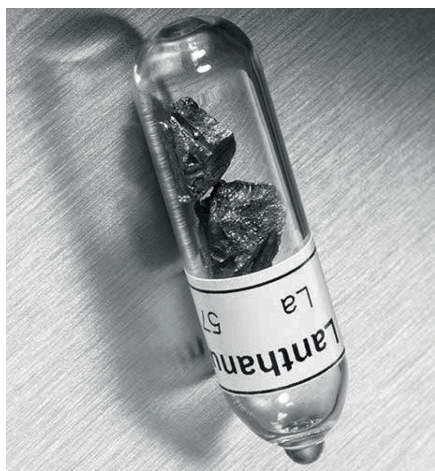
4. ábra. \text{LaH}_{10} -kristályok [13]

Az egyik legtöbbet ígérő vegyület a lantán-hidrid ( \text{LaH}_{10} ) kristályszerkezete, mint leírták, hidrogénrácsok által szögletes hexagonális oldalakból képzett poliéderekből áll, amiknek a közepében ritkaföldfém-atom helyezkedik el (3.b ábra). Feltételezve, hogy e vegyületnek szupravezetése eleget tesz a BCS-elméletnek, a kutatók előre jelezték, hogy átmeneti T_c -jének 270–290 K hőmérsékleten kell jelentkeznie. 2018 elején sikerült szintetizálni az elméletileg előre jelzett \text{LaH}_{10} vegyületet (4. ábra). Nemrég az \text{LaH}_{10} szupravezetését is mérték gyémántsatuban előállított extrém nyomáson. Egy újabb szintézis során a kristályos \text{LaH}_{10} -et in situ létrehozták ammóniumborátról ( \text{NH}_3\text{BH}_3 ) és elemi lantánból is.