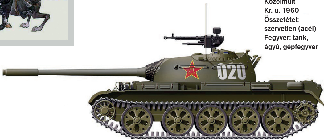
Közelmúlt Kr. u. 1960 Összetétel: szervesetlen (acél) Fegyver: tank, ágyú, gépfegyver