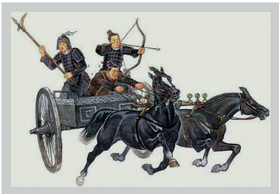
Régmúlt. Kr. e. 220. Összetétel: szervesetlen (kerámia) Fegyver: nyíl, számszerij