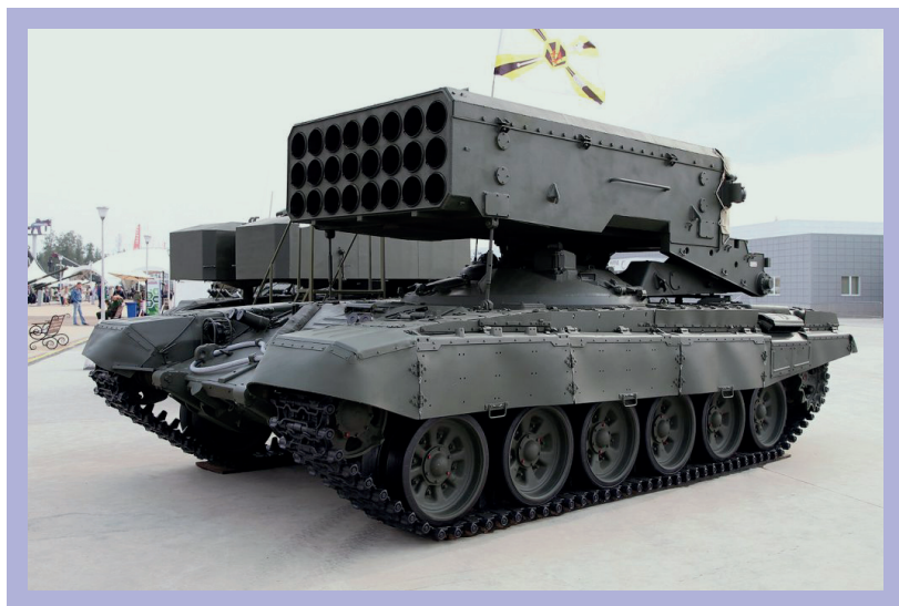
Jelen. Kr. u. 2018. Összetétel: szervesetlen (acél) Fegyver: tank, rakéták