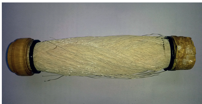
2. ábra. Gázszeparációs modul belső szerkezete

Egyes gázszeparációs kapillárismembrán-moduloknál – bár ezt a gyártók nem verték nagydobra – a kapilláris szálkötegeket nem a megszokott egyenes szálirányú módon ragasztják be a modulba, hanem azokat eltérő irányú felcsévéléssel rögzítik (2. ábra).