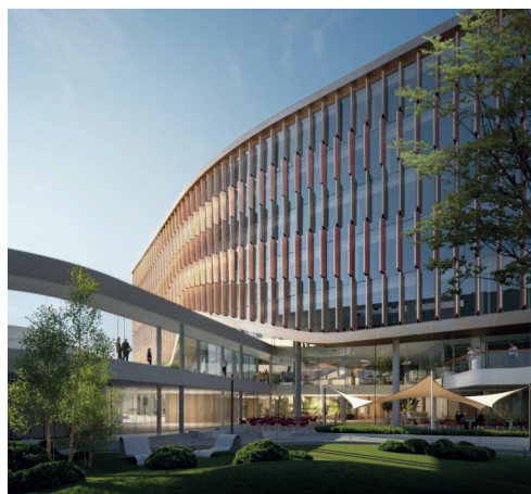
A Richter új irodaépületének látványtervei, Zoboki Építésiroda