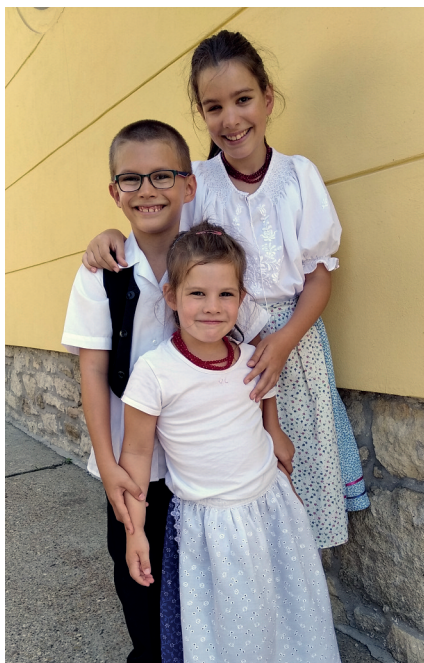
A sor folytatódik...

A kutatás nemzetközisége miatt sok fiatal kutató szembesül az „itthon vagy külföldön” dilemmával? Hozott-e ilyen döntést életé-