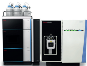
Thermo Scientific™ TSQ Altis™ hármas kvadrupol tömegspektrométer

A felhasználási területtől függetlenül a Thermo Scientific™ TSQ hármas kvadrupol tömegspektrometriás rendszerei kiemelkedő precizitást biztosítanak a mennyiségi meghatározási feladatokra. Nagy felbontású SRM üzemmód, robusztusság, megbízhatóság és érzékenység egy készülékben, mely segítségével minden felhasználó a mérendő komponenstől vagy a mátrixtól függetlenül megbízható mérési eredményekhez juthat.