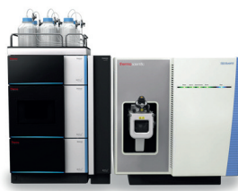
Thermo Scientific™ TSQ Quantis™ hármas kvadrupol tömegspektrométer