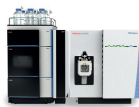
Thermo Scientific™ TSQ Fortis™ hármas kvadrupol tömegspektrométer