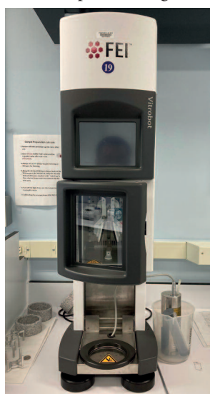
Krio-EM-minta fagyasztása (NIH, USA)

Igen, ez a fagyasztott minta úgy működik, mintha a fénymikroszkóp üveg tárgylemeze lenne, csak természetesen itt nem fotonok, hanem vákuumkamrában nagy sebességre, akár a fénysebesség 70%-