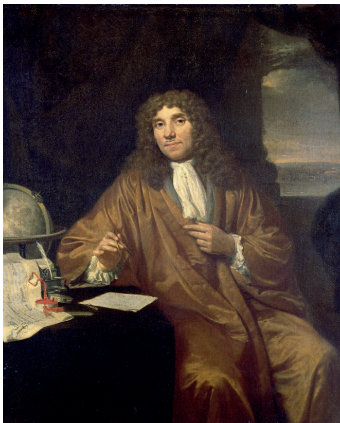
Antonie van Leeuwenhoek Jan Verkolje festményén