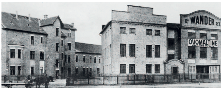
A KÉPEK, AHOL NEM JELÖLJÜK KÜLÖN, AZ EGIS GYÓGYSZERGYÁR ZRT. GYŰJTEMÉNYÉBŐL SZÁRMAZNAK

A vállalat sajtóhirdetésekkel is népszerűsítette az Ovomaltine-t