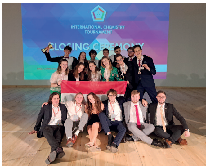
A győztes magyar csapat tagjai (Hungarian Team Red) – a képen a felső sor, balról jobbra haladva: csapatkapi-

A verseny jövő évi helyszíne egyelőre ismeretlen, de mindenképpen lesz magyarországi válogató, mégpedig 2024. január 5-én és 6-án (továbbá a jelentkezők számának függvényében január 4. is opcionális versenynap). A válogató feladatai és szabályzata október elején jelennek meg az International Chemistry Tournament Hungary Facebook oldalán, amelyen sok más hasznos információ mellett egy képriport is található idei versenyzőinkkel és felkészítőikkel. Minden kedves középiskolás olvasónkat arra szeretnénk bátorítani, hogy jelentkezzen a válogatónkra, és legyen részese a közösségünknek!