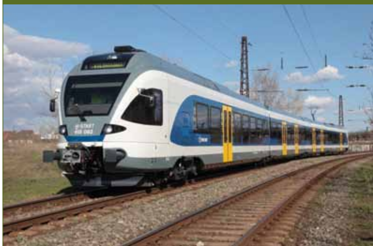
2. ábra: Az új FLIRT motorvonat

A járműbenchmark fontossága, hogy a korábbi saját és mások által elvégzett LCC számításokat bedolgozva kijelölhető a különféle elővárosi vonattípusok gazdaságos felhasználási területe. A 2007-től felgyorsult szervezeti átalakulások jelentősen megváltoztatták, eltorzították a személyszállítás költségeit. A járműjavítók korábbi relatíve kedvező áru felújítási, új gyártási tevékenysége elsorvadt, megszűnt, a vontatási díjak árképzése megváltozott. További lényeges eltérés, hogy a gyártmányfejlesztés eredményeképpen az elmúlt években számos új vasúti technikai, informatikai hardverelemet építettek be a járművekbe. Az utazási komfort növelése iránti fokozódó elvárások, a világcégek együttműködésének erősödése, a tenderekre közös ajánlat benyújtása mind olyan körülmény, amely kismértékben megváltoztathatja az eredeti értékeket.