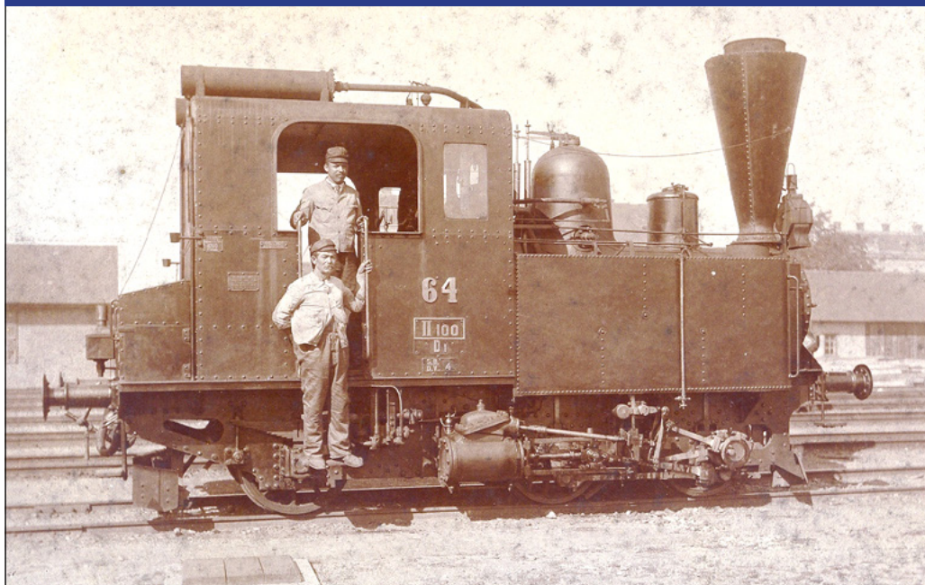
2. ábra: A Déli Vasút egyik gőzmozdonya a szombathelyi pályaudvaron az 1910-es években.

A Vasvármegye újságírója 1921 márciusában még úgy látta, hogy Németújvár (Güssing) és vidéke gazdasági, élelmezési szempontból „a magyar hazából él”. 57