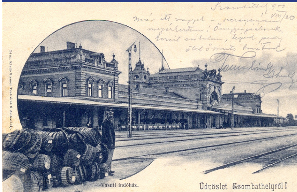
1. ábra: A szombathelyi pályaudvar az 1900-as évek elején. (korabeli képeslap)

alatt 4 zsák búzát (összesen 213 kg) rejtettek el a vasutasok, amit szintén Ausztriába akartak kicsempészni. 1924 áprilisában pedig a nagykanizsa-bécsi gyorsvonat mozdonyvezetője akart több ezer tojást illegálisan átvinni a határon, de lebukott. A hatóságok a csempészarukat lefoglalták és az elkövetők ellen eljárást indítottak. 51