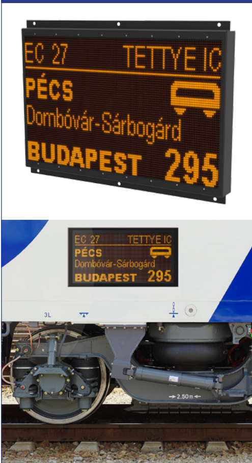
4. ábra: Külső LED utastájékoztató kijelző