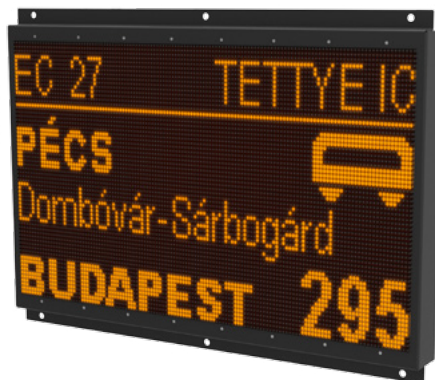
2. ábra: Vasúti járműfedélzeti külső és belső utastájékoztató rendszer hardver elemei

A vasúti közlekedés egyik sajátossága maga a szerelvény vagy más néven vonatösszeállítás felépítése, amely a közlekedési társaság (pl. MÁV Zrt.) által az adott járatnak megfelelően kerül összeállításra mind kocsi számban, mind típusában (termes vagy fülkés kocsik, hálókocsik, étkezőkocsi stb.). Függetlenül attól, hogy az adott vasúti kocsi rendelkezik saját hajtásrendszerrel (motorkocsi) vagy sem, az utastájékoztató alrendszer szempontjából minden vasúti kocsi önálló egységnek tekintendő, azaz minden kocsit el kell látni a járműfedélzeti utastájékoztató rendszer működéséhez szükséges összes részegységgel (2. ábra), beleértve a vezérlőegységet, a különböző kommunikációs modulokat, a hangrendszert és az információs LED és LCD kijelzőket. Az utastájékoztató rendszerrel ellátott kocsiknak egymással együtt kell működni, és az utastájékoztatáshoz szükséges adatokat (járatszám, irány, célállomás, közbelső állomások, aktuális pozíció, stb.) kijelyezni. Az üzemeltetés megkönnyítésére és a kezelőszemélyzet terheltségének csökkentésére biztosítani kell, hogy egyetlen kezelési helyen beállított járatirányi információk az összes kocsi-ban szinkronizálásra kerüljenek.