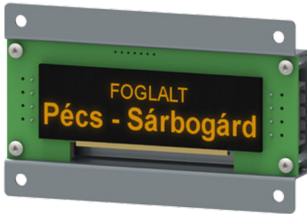
6. ábra: Ülőhelyfoglaltsági kijelzők