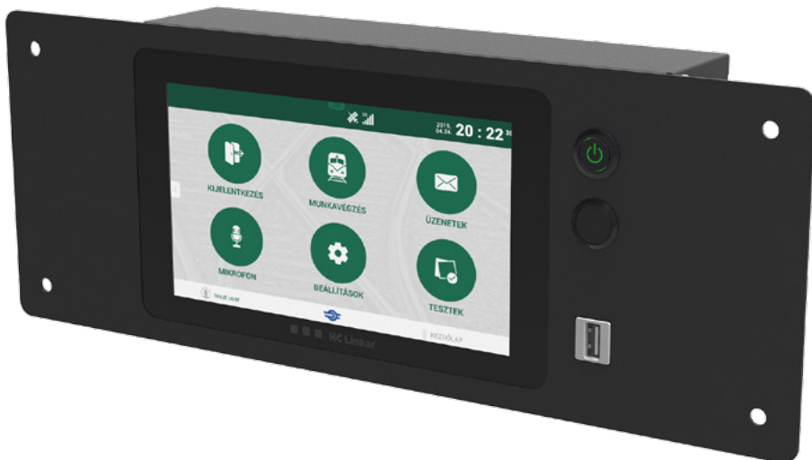
3. ábra: Kezelő és vezérlő egység

LED technológiás, nagy fényerőjű irány- és járatszámtábla (4) ábra), amely általában a kocsi oldalfalán kerül elhelyezésre. Ez a jármű első olyan vizuális utastájékoztató eleme, amellyel az utas találkozik, ezért jól láthatónak és olvashatónak kell lennie, hogy könnyen beazonosíthassa a járatot és a megfelelő vonatra szálljon fel. A LED kijelző főbb funkciói: járat azonosító, vonatt név, vonat típus, kiinduló állomás, közbelső állomás és célállomás kijelzése. A kijelzőnek erős napfényben