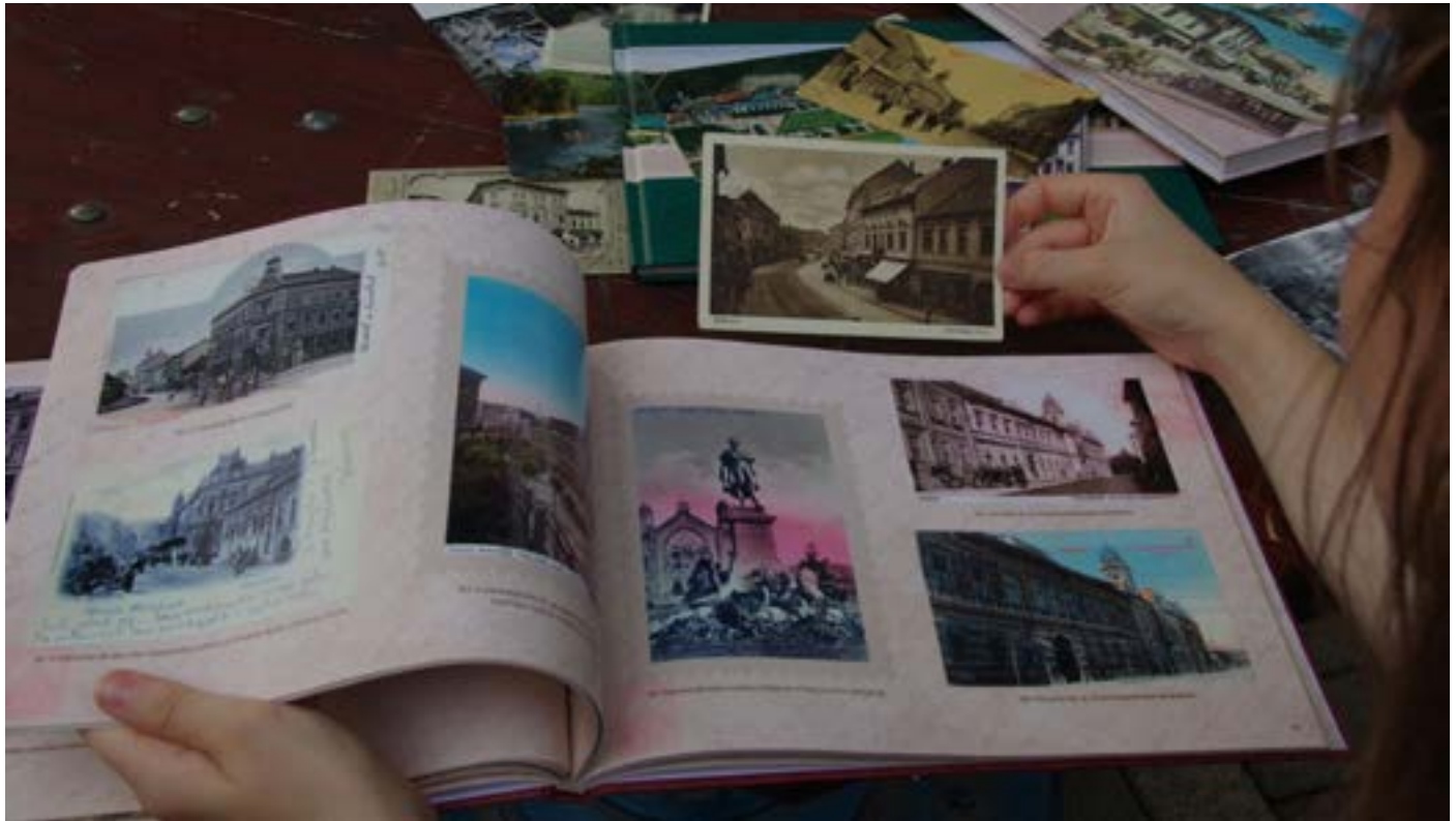
A kötetek megvásárolhatók a II. Rákóczi Ferenc Megyei és Városi Könyvtár központi épületében

A miskolci II. Rákóczi Ferenc Megyei és Városi Könyvtár apró- és kisnyomtatványai között különösen gazdag a helyi témájú képeslapok gyűjteménye. Ezek felhasználásával készült a Miskolc régi képeslapokon című sorozat három kötete.