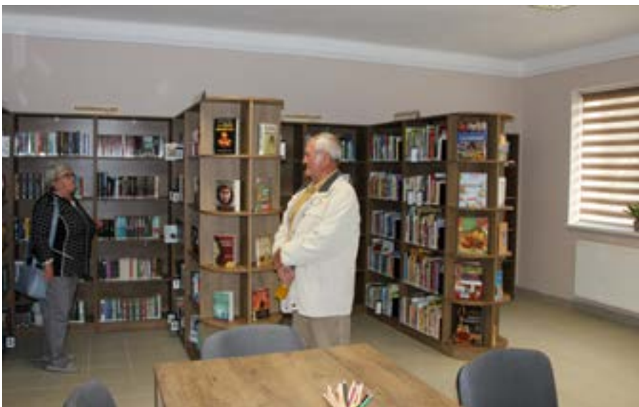
Megújult a tiszapalkonyai könyvtár olvasótere

A Tisza-parti településen már korábban megfogalmazódott az igény, hogy a helyi bibliotékát felújítsák. A tiszapalkonyaiak szeretik könyvtárukat, szomjaznak az olvasnivalókat, lelkes könyvtárhasználók. Az önkormányzat felújította az iskola szomszédságában álló épületet és – lehetőségeihez mérten – könyvespolcokat is vásárolt. Mivel a település csatlakozott a Könyvtárellátási Szolgáltató Rendszerhez (KSZR), a költségvetési törvény által garantált keretösszegeből teljes egészében megújulhatott a könyvtár bútorzata, a belső környezetet is sikerült sokkal otthonosabbá, komfortosabbá varázsolni. A könyvtári állomány elrendezésében és a 21. század igényeinek megfelelő közösségi tér kialakításában a II. Rákóczi Ferenc Megyei és Városi Könyvtár munkatársai nyújtottak segítő kezet a helyi könyvtárosnak.