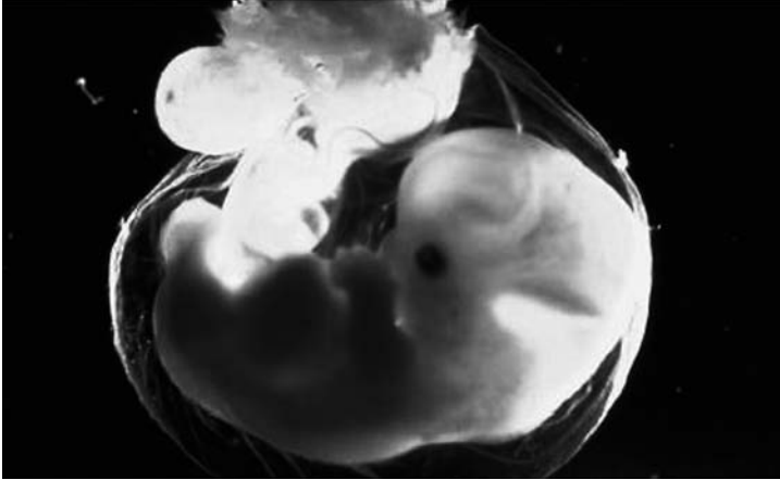
Méhmagzat, 7. hét [20]

Az élveszületés orvosi szakkérdés, ezért az ennek tényét érintő vita igazságügyi orvosszakértői vélemény alapján dönthető el. Orvosszakértői bizonyítást kell lefolytatni akkor is, ha vitás a fogamzás ideje, tehát az, hogy a fogamzásra a születéstől visszafelé számított háromszáz napon belül mikor került sor. De bizonyítás rendelhető el annak megállapítására is, hogy a fogamzás ténylegesen a fenti rendelkezésben meghatározott fogamzási időpont előtt történt. Ennek kapcsán láthatjuk, hogy a Polgári Törvénykönyv által megjelölt fogamzási időpont egy megdönthető vélelem, amelyet az esetleges ellenbizonyítás lefolytatásáig igaznak kell elfogadni.