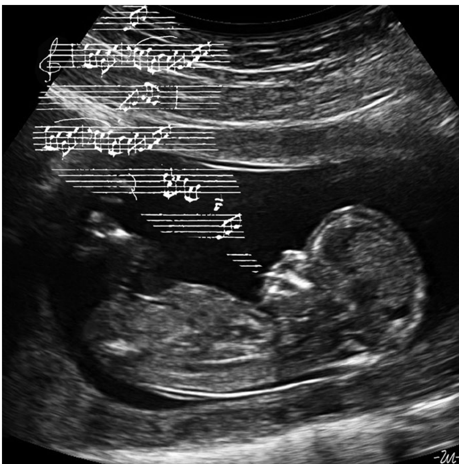
• Halász Géza, Ultrahang