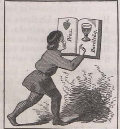
Ákászlevél. A barátság ép olyan hő mint a szerelem.