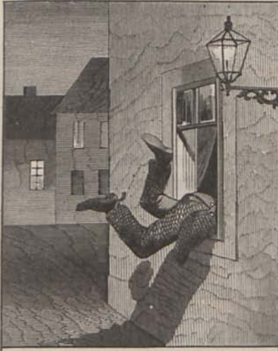
Afonya virág. Ha szólítasz — jövök.