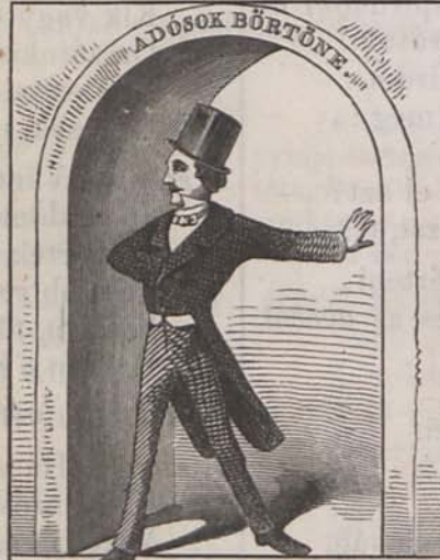
Ákászvirág. Mikor látjuk ismét egymást.