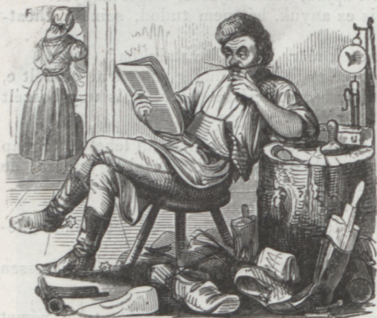
E hétre való orákulumok.

A mit nem kívánsz magadnak, azt hagyj ott másnak. Ha átkarsz ugrni az árkon, túlmérj rajta, mert különben bele esel. A mi nagyon jó, azt meg szokták emni. Ha álarozót tetél föl, ne beszélj a magad hangján.