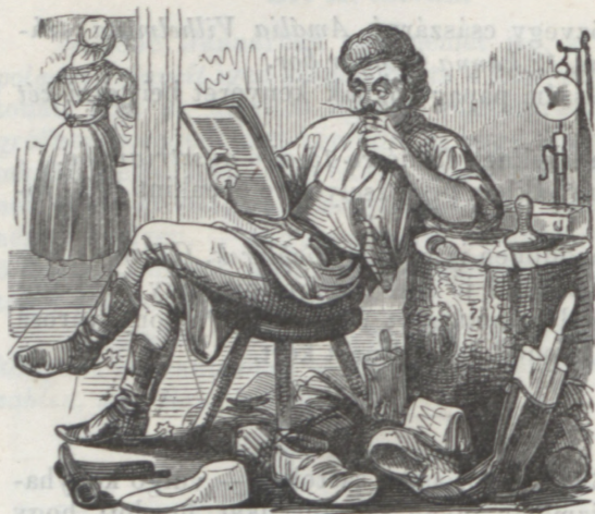
E hétre való orákulumok.

Hol jobb : odakénn-e, a hidegen, vagy odabenn, a hűvö- söny — Telo van a jó barátunk keze tarokkal, a színeik sem egyzenek, hanem azért az „último“ még is a mienk.