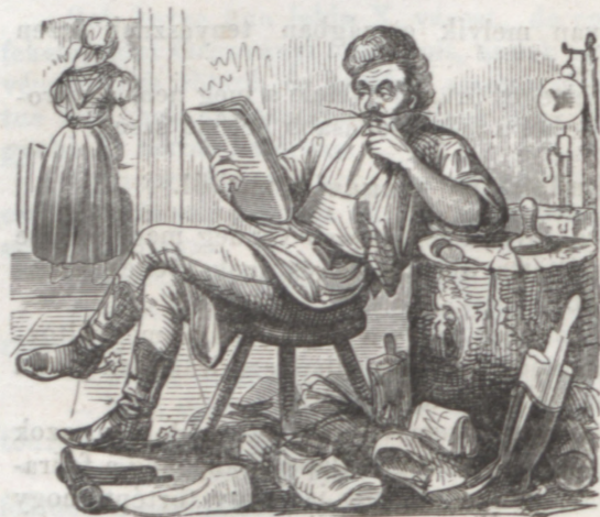
E hétre való orákulumok.

A milyen fegyverrel harczolt Sámson a állszteusok ellen, olyannal viaskodnak most ők és a farizeusok a mai irástudók ellen.