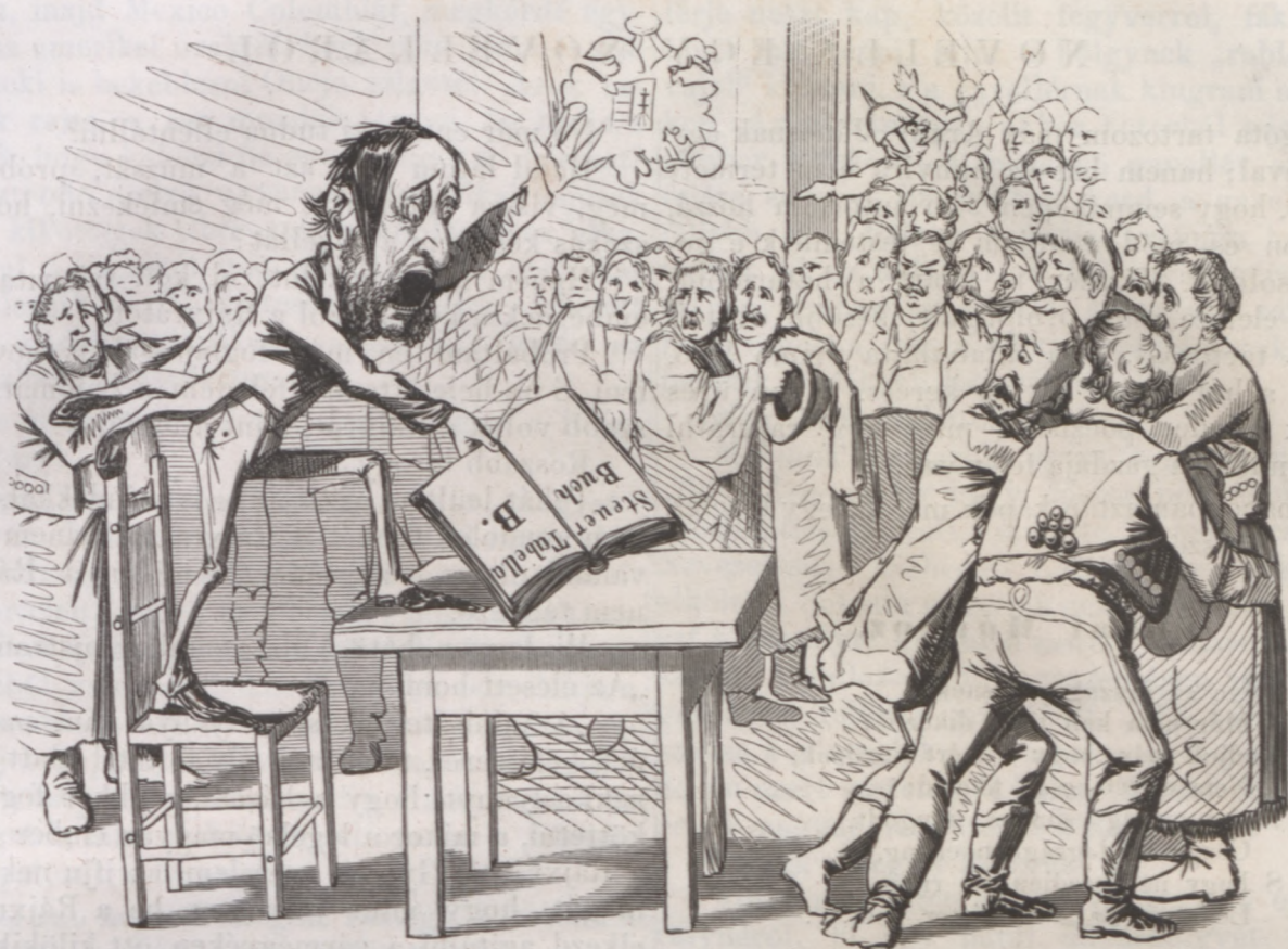
Ez meg a jobban értesült nép.