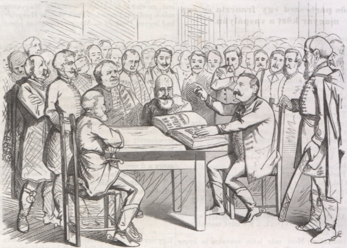
Ez a rosszul értesült nép.

A miniszter ur apellal a rosszul értesült néptől a jobban értesült néphez.