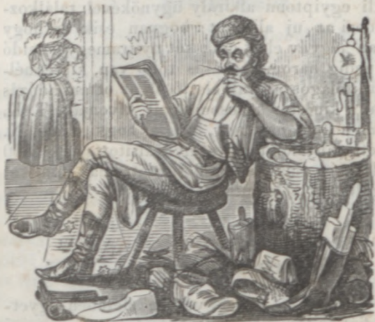
Orakulum. Jó volna talán az előfizetést az űstökésre megújítani!

— — Ez is furcsa : a két legelső áldozat, ki a katonai törvények szigorával találkozók, az egyik Német , a másik Tót .) Ez onnan származik, mivelhogy sehol oly komlét nincs képviselve minden nemzetiség, mint a magyar irodalomban, van nálunk Magyar, Német, Tóth, Oláh, Lengyel, Orosz, Rác, Török, Szász.