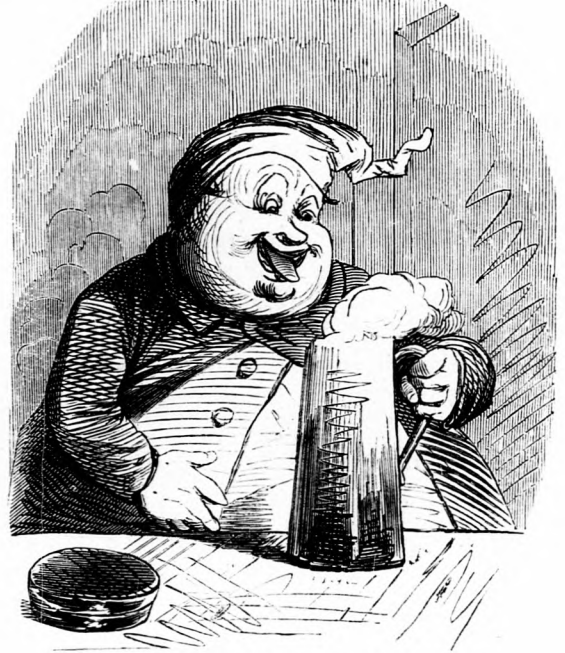
A másik testesül .