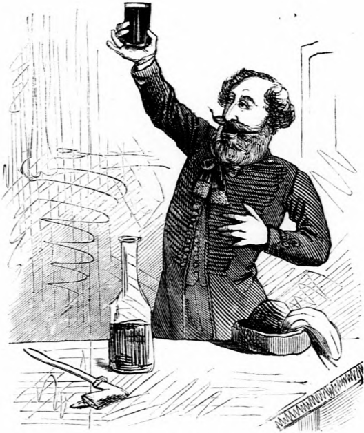
Az egyik lelkesül .