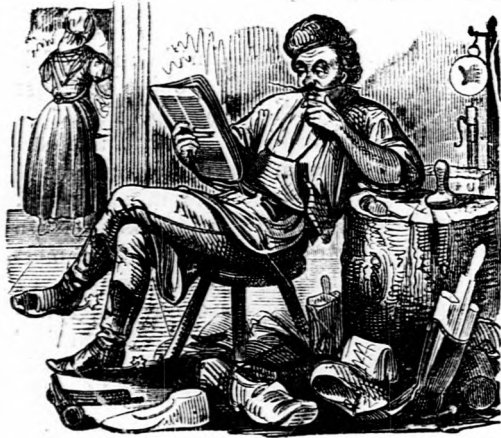
Oraculum. Pallida mors aequo pede pulsat Handabandarum tabernas, Donau-Zeitungerumque turres.

— — A francziák Puebla elfoglalásakor 16 ezer katonát s közte 300 tábornokot, 2400 ezredet s 8000 kisebb nagyobb foku törzstisztet fogtak el. Közkatona is volt egy nehány.