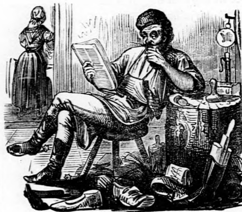
Oraculum. Nagy bősége van a szegény embernek mindennemben, — a mit nem kívánt magának.

— — No itt van egy eredeti ujdonság, a melylyel úgy hiszem, a Pesti Hírnök tetszését is megfogom nyerni. Bizonyos nagy bukásnál, mely e napokban a főváros kereskedő köreit felvillanyozta, következő emlékezetes eset történt egy gabona kereskedővel. Egy szép pénteken délután megalkudott az illető házfőnökkel ötezer mérő gabonára. Még az nap este be is méretett a raktárába öt száz mérőt. Más nap azonban szombat lévén, a gabnakereskedő azt mondá; „ez az én ünnepem, azt én megtartom, szombat napon nem mérek gabonát.“ Másnap megint sürgetik, hogy méresse át a hátrálékot, akkor megint azt mondta, „ez meg a te ünneped, vasárnap, ezt is meg kell tartani, ezen a napon nem mérek gabonát. Harmadnap hétfő volt, akkor már nagyon sarkalták a kereskedőt, hogy jöjjön már a lapáttal, mérje azt a gabonát frissen. De a kereskedőnek kalendariuma volt, abban a hétfő is piros betűvel volt nyomtatva: rendületlenül megállta: „ma sem mérek gabonát, mert ma Boldogasszony ünnepe van.“ — Kedden aztán megbukott a nagy üzér; felfüggeszté a fizetéseit, beadta a kulcsot, s a jámbor zsidónak négyezeröttszáz mérő gabonája menekült meg, a miért olyan lelkiismeretesen megtartá mind a maga, mind a más ünnepeit. Ha megszegi ez ünnepeket, most az is elúszott volna.