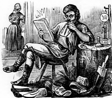
Oraculum. A levesosztó intézetek már megszűntek, hanem a fekete levesosztógatók még nem.

— Szultán ő felsége is szokott lóversenyeket rendezni, hanem azokon természetesen az ő lovának „muszáj“ nyerni. Mert hiszen majd lenne ne mulass annak a halandónak, a ki őt fél lófejjel meg merné előzni; az majd egész emberfejjel hamarabb érne a paradicsomba, mint szándékozott. Az unokaöcse azonban, a leendő trónörökös, még is csak mert vele daczolni; azt tette, hogy Angliából hozatott egy olyan jó paripát, a mi ő felségét bizonynyal leverte volna. A padisah azonban könnyű szerrel segített magán. A verseny napján lovat, lovászt és lótulajdonost becsukatta a héttornyú várba.