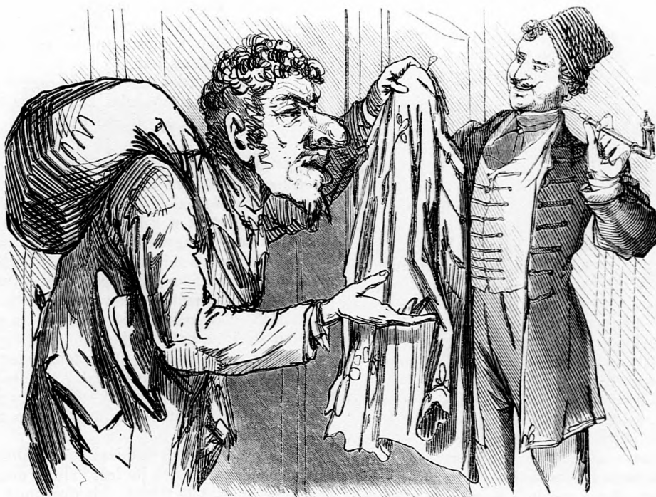
Az alkudozásra hajlandó hazafiak.