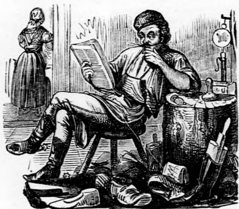
ORACIUM. Akár hűde, akár undé, de mint a dolognak az idebúdjé az, hogy sem ide, sem oda, hanem csak éppen hát hogy no. A ki föltét tud, mondja tovább.