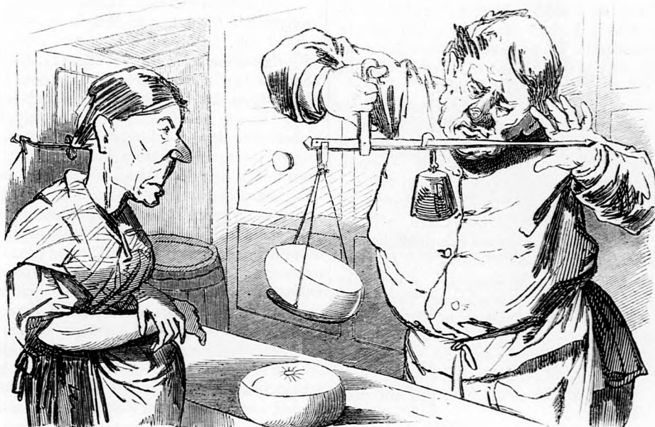
A mindent megfontoló hazafiak.