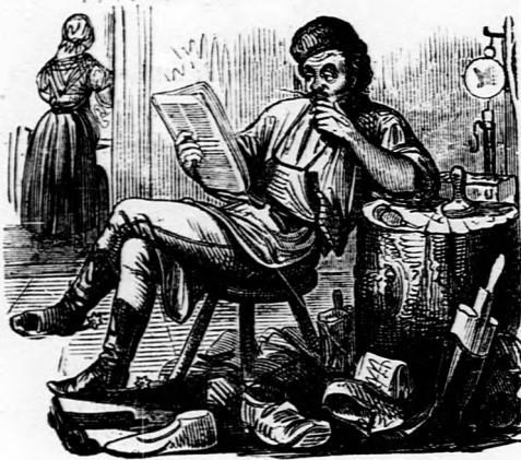
ORÁCULUM. Hogy éltink meg az idén ebben a nagy — boldogságban?

— — Egy angol városban két oroszlán kiszabadult a menaszériából s aztán con amore sétálgatott fel és le az utcán, a nélkül, hogy bántott volna valakit, vagy a nép megijedt volna tőlük. (Ugyan ki is félné már az angol oroszlántul?)