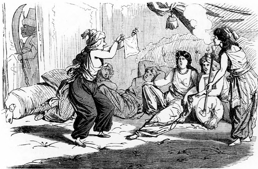
III. „Nézzétek, milyen kicsiny kendőket kezdenek már az embernek hajítani!”