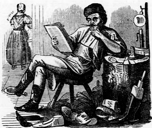
ORÁCULUM. Mindeneket elhigytetek; a mi rossz, azt meglátjátok.

— — Hirlapokból olvasom: Napoleon császár átadja a kseftet a fiának, meg az unokaöcsésének, ő maga privatiér lesz. (Mi az a privatyíé?) A privatiér? Az olyan bummler, a kinek van pénze. (Hát az a bummler micsoda?) A bummler? az meg olyan privatiér, a kinek nincs pénze. (Már most tudom.) Ugyanazon lapok írják, hogy báró Sennyei magyar kancellár lesz. Ugyanezen hitelt érdemlő kutforrások szerint, Konstantin nagy herczeg a lengyel forradalom élére állt; — a pápa elhagyja Rómát és Esztergomba jön lakni; — a Constitutionelle Oesterreichische Zeitung nem fogad el subventiót a kormánytól, — Anglia visszafoglalta Düppelt; — a sultán megengedte kihirdettetni az encyclicát; — Izabella királyné pedig anglicán hitre tért