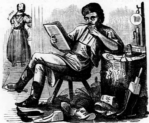
ORÁCULUM. Soha sem vártunk úgy az 1-ső májusra, mint most.

— — A rabszolgatartók tehát kikapták a magukét. Csakhogy még is már az igazság istenasszonya valahára kinyitotta a szemeit, s a becsületes embereknek ítélte. Az igaz, hogy ez a föld tulsó oldalán történt, s ő sem tartja egyszerre mind a két hemiszfériumot szemmel. A köztársaság államtitkárja sorbavette a dikceziójában, a mit a nyujorki népek tartott, az európai potentátokat, s mondott neki ilyenforma szép dolgokat: „megirom lord Russelnek, hogy mi nem fogjuk őt bántani, ha szépen viseli magát, de ha a saját népe elugratja őt magától, azt nem akadályozzuk meg. — Megirom Napoleon császárnak, hogy elviheti már a dohányját, ha még meg van. (Nem tudom, nem a mexicói sereget értette-e alatta?) Megirom a chinai császárnak, hogy nagyon szép volt tőle, hogy nem pártolta a rabszolgatartó tengeri rablót, mint az európai tengeri hatalmak. Megirom a dahomaji császárnak, hogy több fekete alattvalójának a bőrét már ezután nem veszik meg Amerika számára.