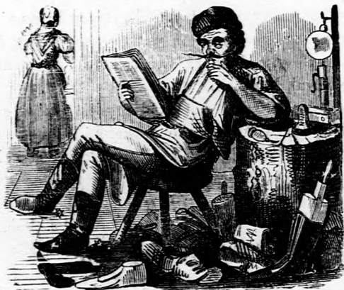
ORACULUM. Adjon az Isten, a mi nincsen, vegye el, a mi — volt legyen.

— — Ez is jó jelenség! Hirnök János bátyánk akkora sas tollat tüzött fel a kalapja mellé, mint Tuhutum. Ez szükséges is, hogy a bécsiek ne mondassák, hogy ők egy cylinderkalappal magasabbak, mint mi; mert mi meg egy sastollal magasabbak vagyunk, mint ők cylinderestül, — s meg van a — suprematia!