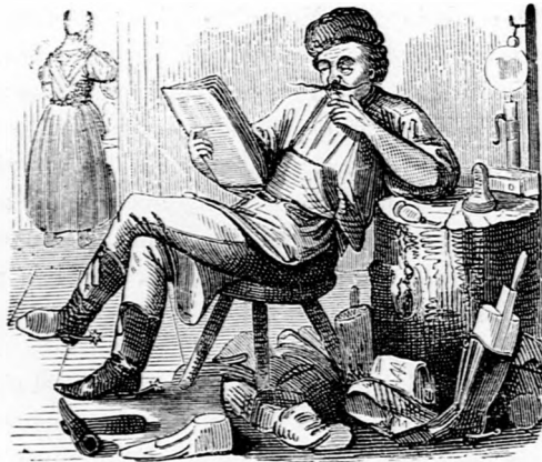
ORÁCULUM, Ma ingyer, holnap pénzért!

— — Az a kérdés foglalkodtatja jelenleg az országos köröket, valjon ki lesz az a boldog halandó, a ki az új országházat a legelső dictióval fel fogja szentelni? ki fogja benne tartani a legelső maidenspechet (szűzbeszédet), ki fogja benne kivívni a legelső „éljentyt?”