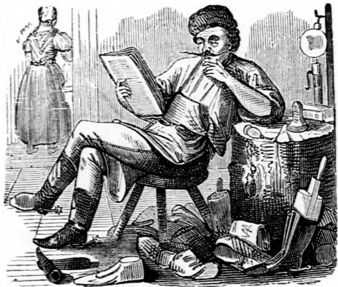
ORÁCULUM. És hát csakugyan kihúzta az időjárás, hogy az országgyűlés belesik a nyárba.

— — Ez azután az élvezetek hete! Először a Patti concertek, azután Dumas papa kozeriái: azután az akadémia nagy gyűlése, végtére az országgyűlés. E tárgyaknál a következő dolgokul nem szeretnék referálni: a négy közül melyik volt a legélvezetesebb; miután mind a négy nagyon élvezetes lesz; — melyikbe lehetett legnehezebben bejutni? miután háromba csakugyan nehéz volt bejutni; melyikben unta magát a közönség legjobban? miután kettőben aligha nagyon nem fogja magát unni a közönség, és végre, hogy melyikbe fizettek legmagasabb belépti díjakat, miután egybe a négy közül csakugyan mesés entreékat fizettek.