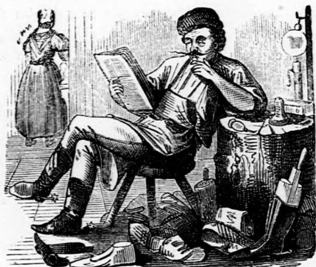
ORÁCULUM. Vannak dolgok, a miket könnyebb újra kezdeni, mint folytatni.

A politikus csizmadia referál feleségének a világ állapotjáról.