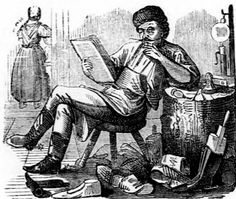
ORÁCULUM. Nem minden october 20-án van 20-ik october.

— — (Miért ütlegelik Prágában a jezsuitákat?) Hát hiszen elébb a város előkelői elég szépen kapacitáltak a priori , hogy vigye odább a collégiumát, de csak nem akarta megérteni a dolgot, a csehek aztán, látván, hogy a priori nem megy a kapacitálás, elkezdtek a posteriori argumentálódni.