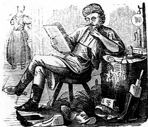
ORÁCUMUM. A hivatal — meg nem esal ; — — — — — hanem a hivatalnok néha.

— — A Debatte a főlovászmester kineveztetését közölvén, azon sajtóhibát követte el, hogy ő excellentiáját „Agaronum regalium magister“nek tette meg. Mikor aztán figyelmeztették rá, hogy nem a királyi agarakra fog az felügyelni, akkor kiigazította a sajtóhibát, s megtette Amazonum regalium magister “nek.