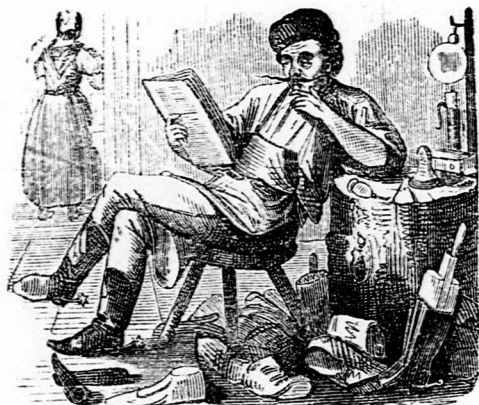
ORÁCULUM. Keljünk fel — pihenni!

— — Érdemrendet kapott a többek közt X. táblabíró ur is, s szörnyen mutatta, mintha azt se bánta volna nagyon, ha nem kapott volna. — Vigasztalták a jó barátai, hogy ha már megvan, hát hadd legyen meg, hiszen nem kér az enni . Ebédnél azonban ráhajtottak az ismerősök, hogy az érdemrend áldomását meg kell ülni; s biz azok elfogyasztottak huszonnégy palaczk pezsgőt a rovására. „Már hiszen enni nem kér az érdemrend; — monda a feldekorált, — de inni ugyan kér! ”