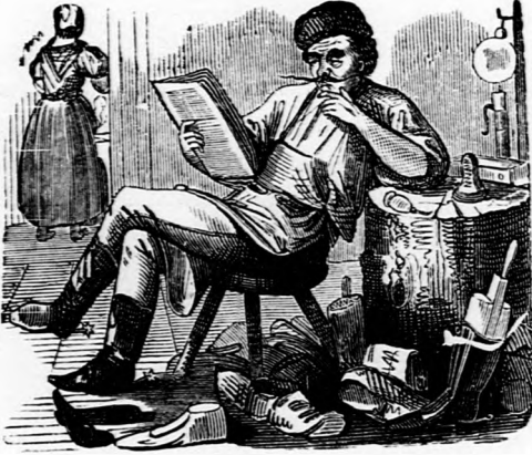
ORÉCULUM. Most már volna kivél mulat ni, hanem most meg a mulatság nem tetszik

— — No iszen kijutott Kemény Zsigmond barátunknak a nemezisből. Ezen a héten valahányszor cikket íratott a Hon szerkesztőjének csúfolására, mindannyinak az volt a kadenziaja, hogy Jókai poéta, ergo nem ért a politikához. Szombatán aztán — megpihenvén a munkatársak a fáradságból, — jön a Pesti Naplóhoz egy „muszáj“ közlés, melyben Kossuth saját jó Pesti Naplójában elébb jól végigporozza az apró munkatársakat, végre Zsigó barátunkat világosítja fel a felől, hogy a mit eddig mint historicumot irt, az csak mind regényírás volt. (Már most tehát ad formam „du Jurát!“ szidhatja egymást a két szerkesztő „du Poét!“-nak.)