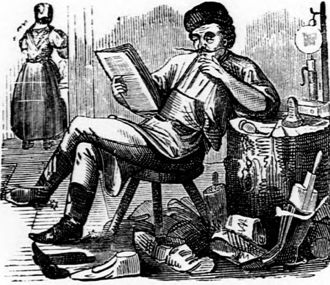
ORÁCULUM. Béküljünk ki, — aztán kezdjünk egy kis háborút.