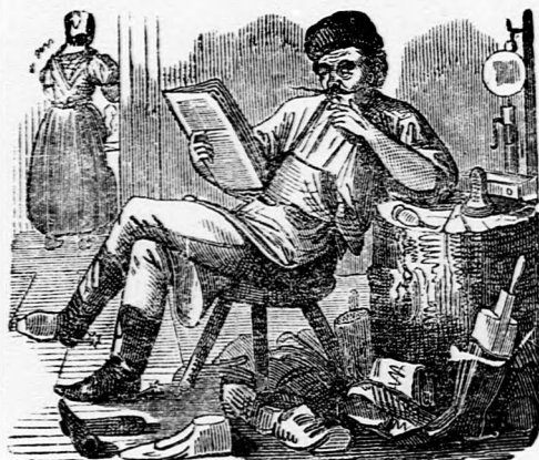
ORÁCULUM. Szeretnénk mi félni, — csak azt várjuk, hogy megijesszeitek.