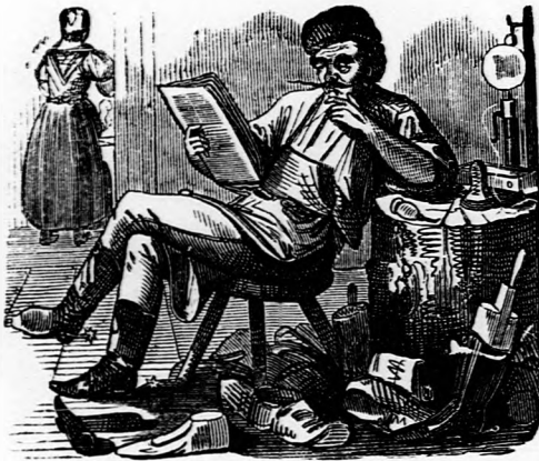
ORÁCULUM. Ha sokan vagyunk, igazunk van; ha kevesen vagyunk, nincs igazunk.

— — (Hallja kend, új ez a mi alkotmányunk?) dehogyan új! (Hát kopott?) Az sem! (Hát micsoda?) Ez egy fejelés alkotmány.