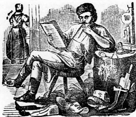
ORÁCULUM. „Az igaz nem fél az Idők Tanujától. (Berzsenyi.)

— — A finanszminiszter ur azt mondta, hogy az alkotmányosságnak legfőbb bizonyítéka az, ha egy képviselőtestület bir az adómegszavazás jogával. (Hát hiszen az adómegszavazás jogával már bizonyos, hogy birunk; hanem hogy az adómegnemszavazás jogával birunk-e? az még nem tudatik.)