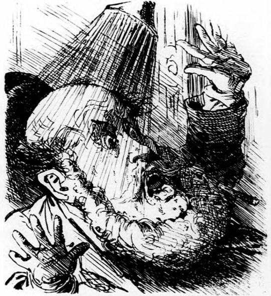
A villanygép rá ereszt a kopasz fejére egy kis friss zuhanyt.