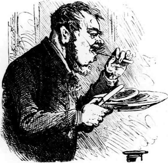
Mikor a képviselő legjobban sonkázik.

Mivelhogy az eddigi készülék csak azt teszi, hogy a budgetbe kivándorlókat becsengeti; de ha nem akarnak menni, hát nem mennek: annálfogva jövőre ilyen telegráf-készülék fog alkalmaztatni.