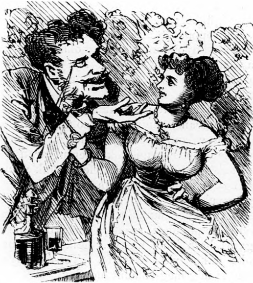
Es mikor egy képviselő a buffet Hébéinek udvarol javában.