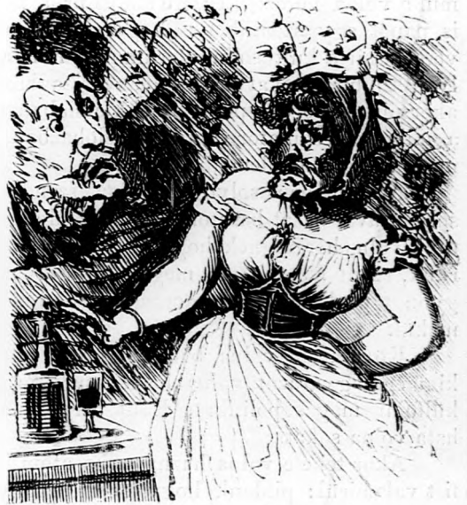
A villanygép egyszerre Hebukává alakítja azt át.