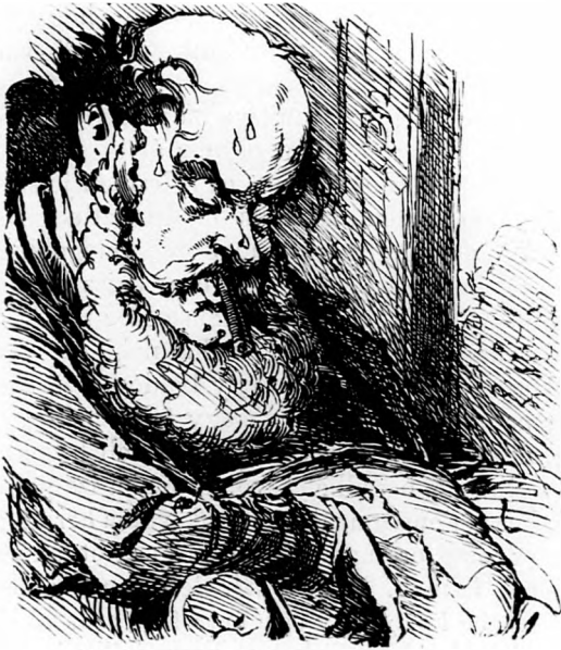
Mikor egy képviselőt szépen elnyomott a buzgóság odakinn.