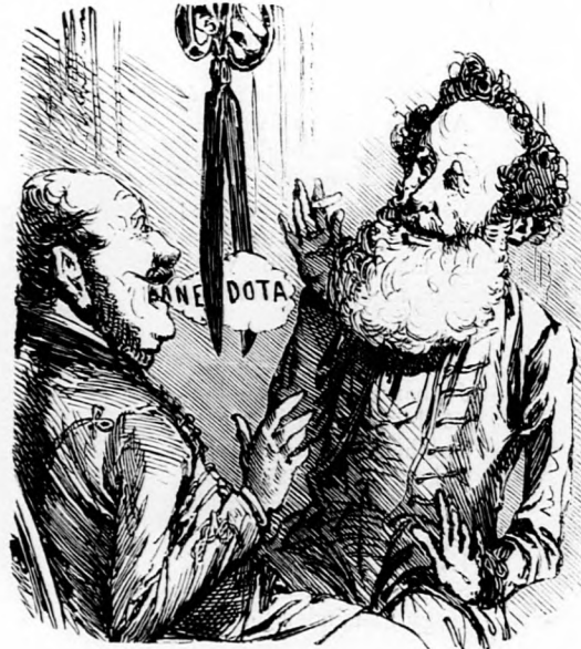
Egyszer csak egy villanyolló ketté metszi a szájukban az anekdotázást.