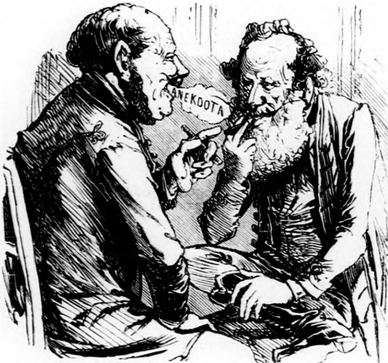
Mikor két képviselő szörnyen belemerült az anekdotázásba.