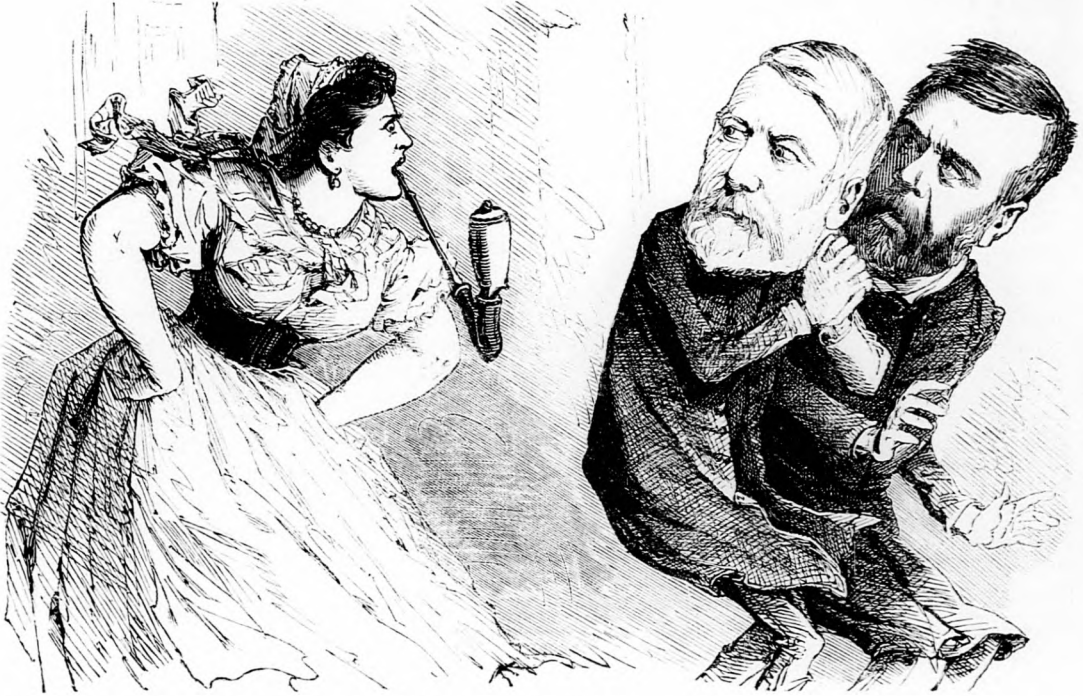
H. Bódi. De ugy jó lesz, mikor az ember késő este kerül haza, s az asszony nem pörölhet, csak félszájjal!