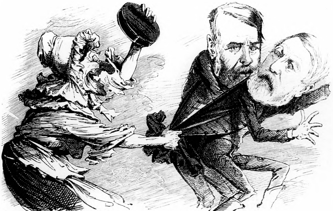
Éltes asszonyság. Hohó uraim! A tubákoló hölgyekről meg sem emlékeztek önök. Nem alkotnának a mi kedvünkért egy kis extra törvényezikket?