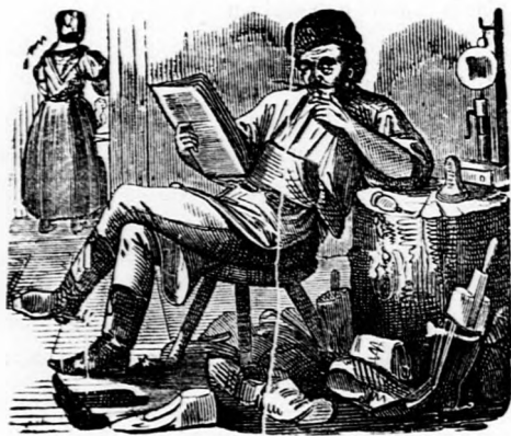
ORÁCULUM. Megértük azt az időt, hogy még az adótól is fizetünk — adót.

— — Ujságot mondok, asszony. (Halljuk.) Az egész baloldalt légbé akarták röpiteni. (Ne mondja kend!) Az ám, mikor együtt tarokkoztak a körben, hát egyszer csak beröpül az ablakon egy Orsini-bomba és elsül. (Hiszen ez attentátum!) Igen, de nem történt semmi veszedelem, mert ezeken a tigriseken még a tűzeső se fog.