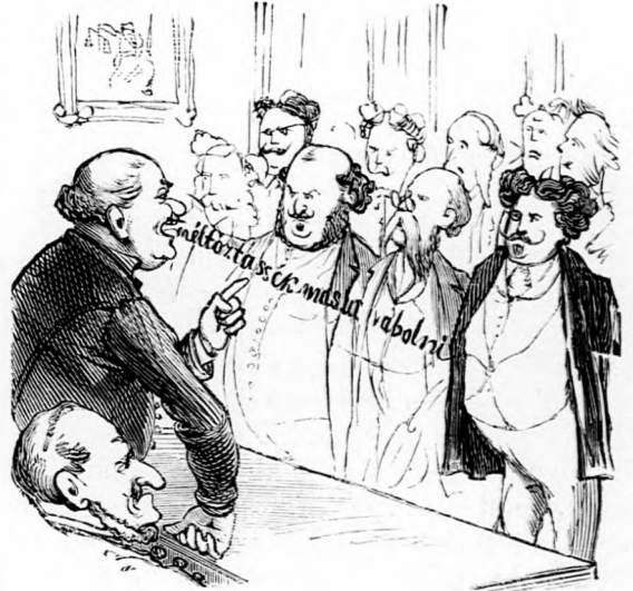
6. Az elfogottak mindannyian, vétségükhöz arányosított szigorú megfenyítésben részesültek.