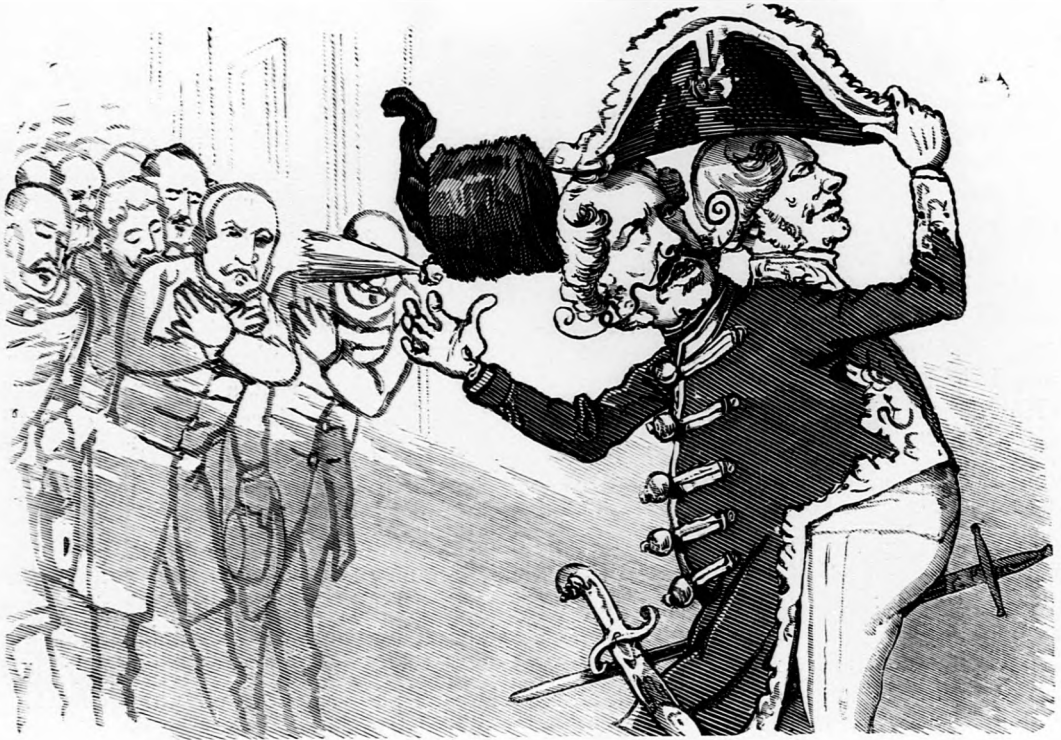
1. Midőn a magyar delegatusok közt mutatja be magát.