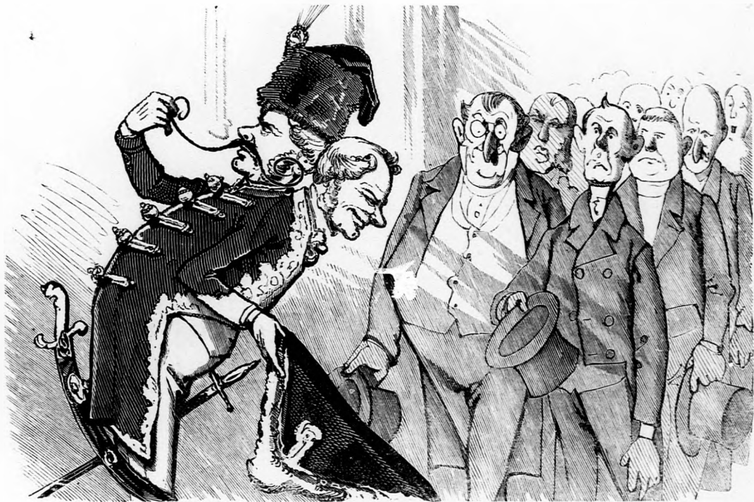
2. Midőn a német delegátusoknál prezentálja magát.

gyerekeket? Mink. Nemes város adja. Hát nemes városnak meghajolni kell.